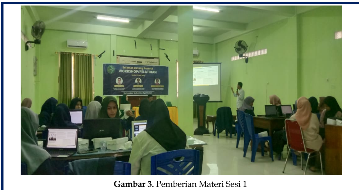
Gambar 3. Pemberian Materi Sesi 1

Pelatihan ini diawali dengan pemberian materi mengenai ruang lingkup plagiat dan strategi pencegahannya. Dalam materi ini, tim pengabdian menjelaskan tentang ruang lingkup plagiarisme, yang diawali dengan contoh kasus-kasus plagiarisme yang sempat mencuat di pemberitaan nasional. Kemudian dilanjutkan dengan penjelasan mengenai aturan-aturan pemerintah dalam menindaki dan menanggulangi kasus plagiarisme. Materi inti tentang lingkup plagiarisme serta strategi pencegahannya disampaikan secara mendalam dengan menekankan pada bentuk-bentuk plagiarisme yang sering terjadi pada karya ilmiah mahasiswa (skripsi). Bentuk-bentuk penulisan kutipan, parafrase, dan referensi yang berindikasi plagiat sedikit disinggung untuk menjadi pengantar pada materi berikutnya.