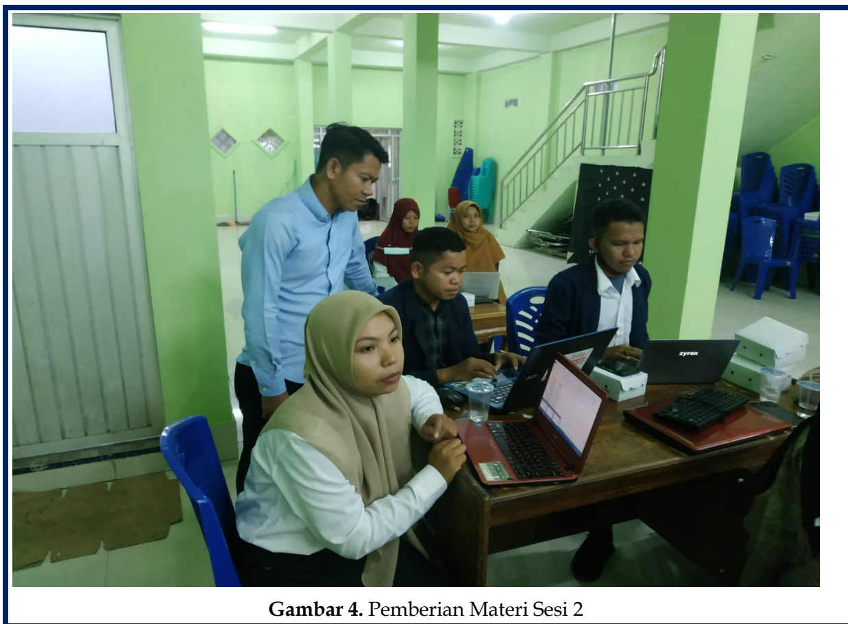
Gambar 4. Pemberian Materi Sesi 2