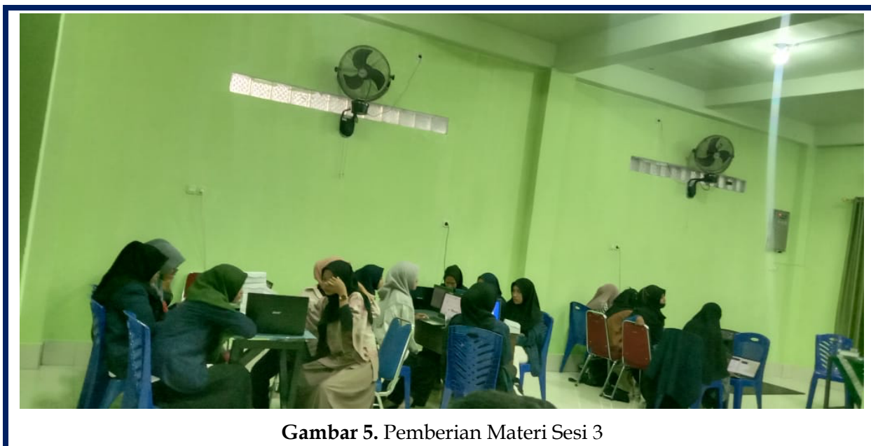
Gambar 5. Pemberian Materi Sesi 3