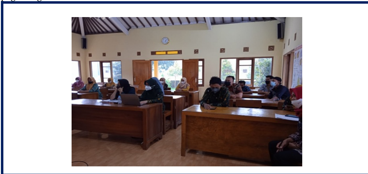
Gambar 2. Paparan dan FGD Analisis Situasi

penginapan. Dalam bidang kuliner beberapa jenis usaha yang dilakukan adalah pembuatan geblek (makanan khas daerah Kulon Progo), gula aren, slondok singkong, teh, kopi, tempe daun, bakso, kristal aren, wedang jahe merah, dan masih banyak lagi. Dalam bidang kerajinan jenis usaha yang dilakukan pembuatan pot, anyaman bambu, dan besek. Perkebunan yang sedang dikembangkan adalah perkebunan kopi. Hasil dari perkebunan kopi ini akan dipanen tiga tahun mendatang. Potensi penginapan yang dikembangkan oleh warga adalah penginapan yang ditujukan untuk para wisatawan yang ingin menikmati pemandangan pegunungan.