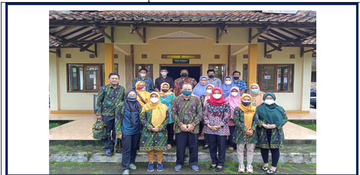
Gambar 3. Dokumentasi FGD Analisis Kebutuhan

Kegiatan selanjutnya adalah FGD Analisis Kebutuhan yang hanya melibatkan para dosen dan ketua BUM Desa saja. Tujuan dari diskusi ini adalah menyampaikan hasil analisis situasi yang dilakukan para dosen kepada pihak BUM Desa. Program-program yang dilakukan oleh setiap dosen berbeda-beda sesuai dengan latar belakang pendidikan dari dosen dan UMKM yang akan diberikan pelatihan atau penyuluhan. Harapan dari kegiatan ini adalah terciptanya program yang benar-benar akan berguna untuk para pelaku UMKM di Desa Pagerharjo