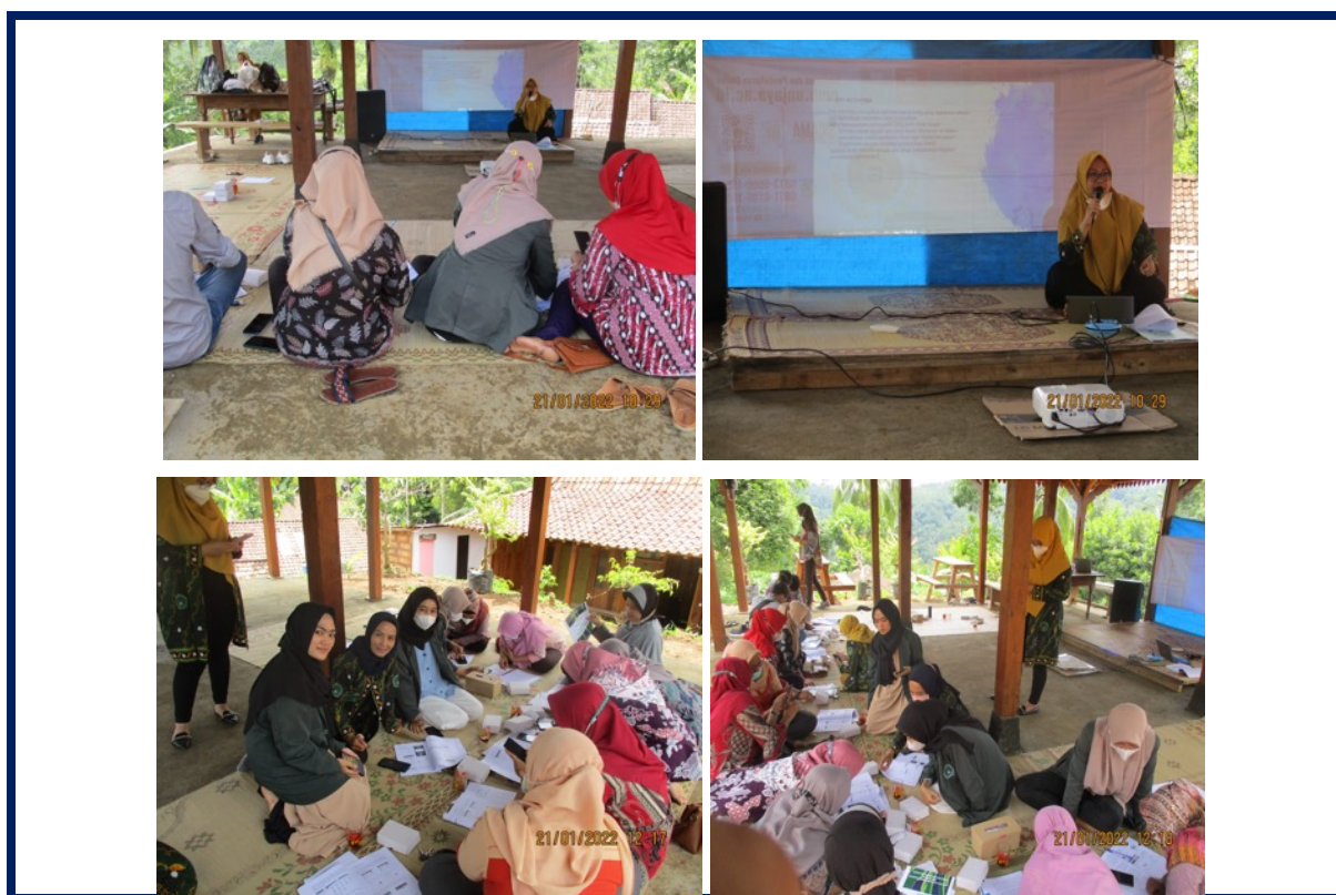
Gambar 4. Pelatihan Penyusunan Business Model Canvas

Metode pelatihan yang dilakukan adalah ceramah, diskusi, dan langsung praktek penyusunan Business Model Canvas . Dalam praktek penyusunan ini peneliti dibantu dengan beberapa asisten mahasiswa. Asisten mahasiswa bertugas membantu peserta ketika memiliki kesulitan dalam mengisi instrumen Business Model Canvas .