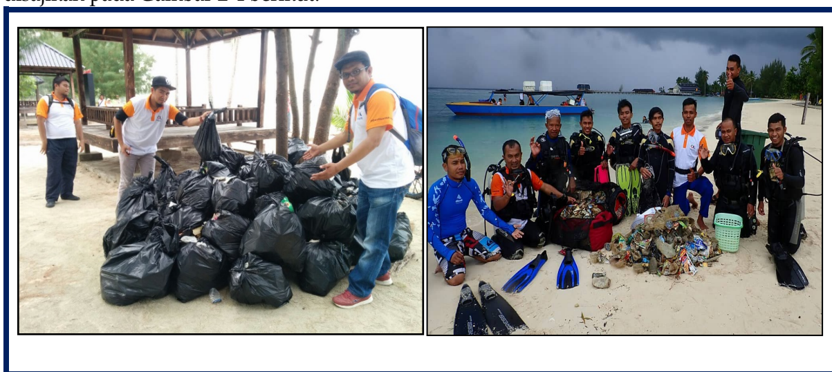
Gambar 2. Pembersihan sampah plastik Pulau Bokori baik di darat dan di laut

Kegiatan bakti pesisir di Pulau Bokori menetapkan dua output penting sebagai standar ketercapaian pelaksanaan program yaitu (1) pembersihan sampah darat ( on land ) dan sampah laut ( on the sea ) khususnya sampah-sampah jenis plastik dan material fiber serta (2) pencangkakan terumbu karang menggunakan metode transplantasi karang dalam rangka pemulihan ekosistem bawah laut Pulau Bokori. Outcame program ini adalah menumbuhkan keasadaran dan kepedulian para wisatawan dan masyarakat pada umumnya untuk Bersama-sama menjaga keasrian dan kelestaraan ekosistem laut Pulau Bokori sebagai salah satu kawasan ekowisata bahari (andalan) di Kabupaten Konawe. Beberapa kegiatan tersebut disajikan pada Gambar 2-4 berikut.