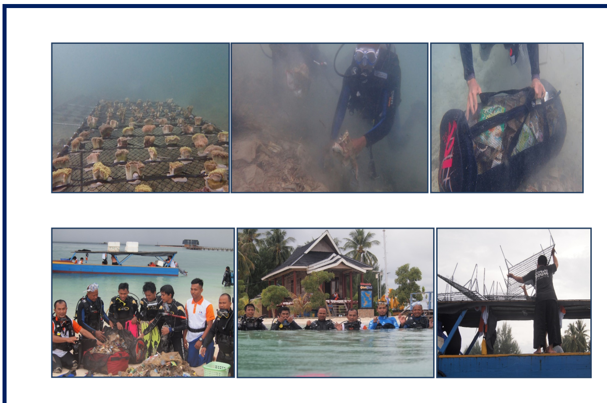
Gambar 4. Prosesi Transplantasi Karang dan Pengambilan Sampah Laut