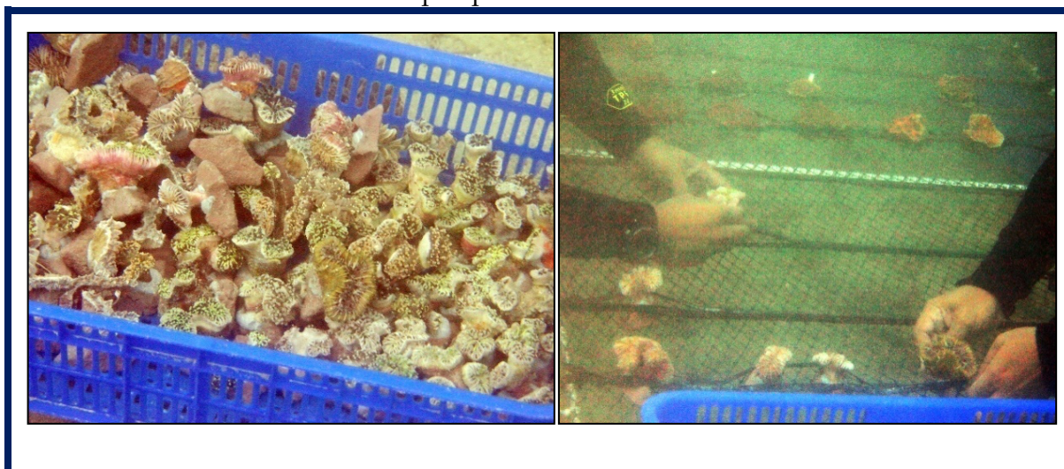
Gambar 3. Bibit karang dan kegiatan transplantasi di bawah air