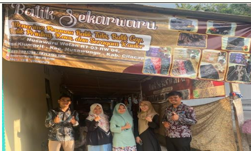
Gambar 4. Tahapan Survei

Untuk melaksanakan kegiatan ini, tahapan awal yang dilakukan adalah survei di Batik Sekarwaru. Survei ini bertujuan untuk menganalisis limbah batik yang dihasilkan di Sekarwaru dan membandingkannya dengan temuan dari penelitian-penelitian sebelumnya. Tahapan awal untuk mengetahui dan memberikan manfaat dengan Survei ke Lokasi Batik Sekarwaru seperti terlihat pada Gambar 3. Dibawah ini. Tahapan ini survei berada di tempat Batik Desa Sekarwaru.