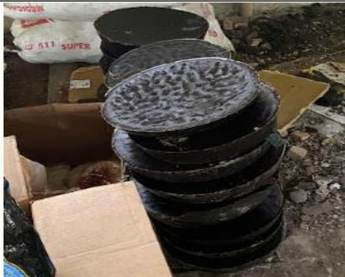
Gambar 5. Pemanfaatan Limbah Batik sebagai Malam (Candle Wax)

Berdasarkan penelitian sebelumnya, metode koagulasi sering digunakan dalam pengolahan limbah batik untuk mengurangi kandungan zat berbahaya. Namun, hasil survei menunjukkan bahwa di Batik Sekarwaru, tidak semua limbah memerlukan proses koagulasi karena sebagian limbah yang dihasilkan dapat dimanfaatkan kembali menjadi malam (candle wax). Malam yang dihasilkan dari limbah ini dapat digunakan ulang dalam proses produksi batik berikutnya, mengurangi jumlah limbah yang harus diolah lebih lanjut, serta memberikan manfaat ekonomis tambahan bagi pengrajin batik.