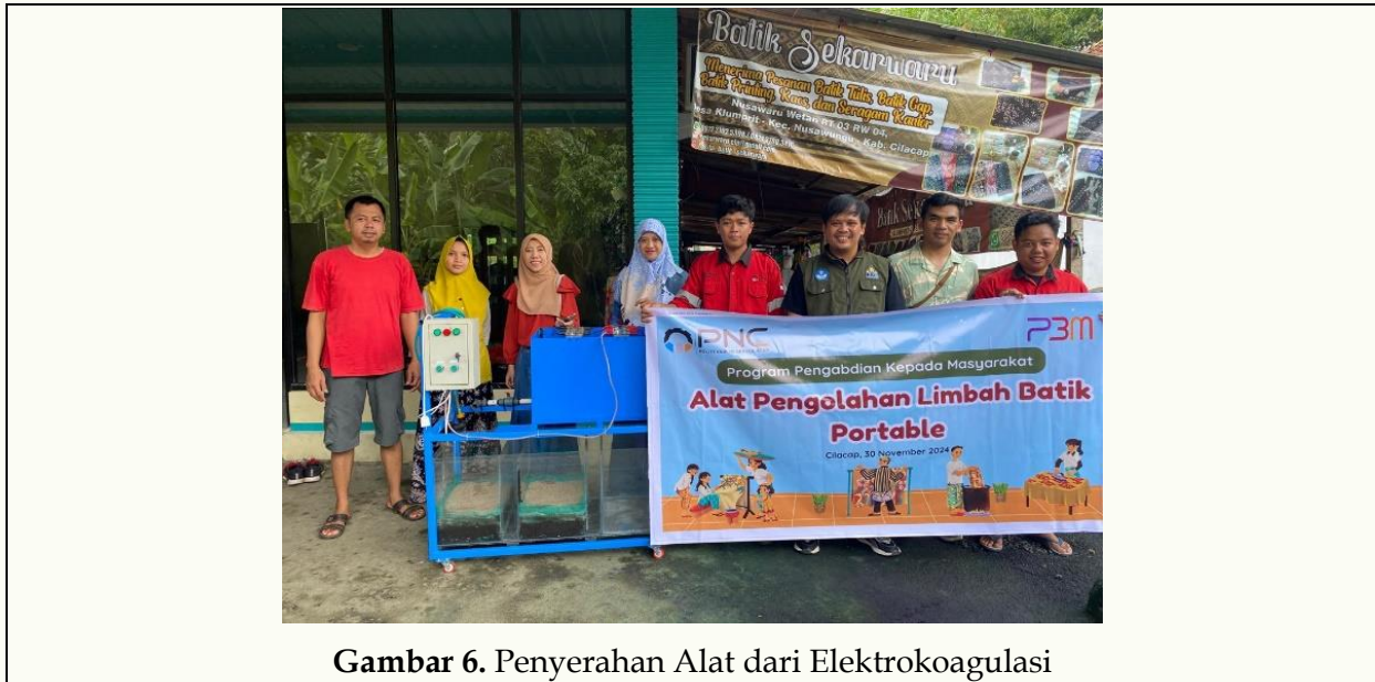
Gambar 6. Penyerahan Alat dari Elektrokoagulasi

Gambar ini menunjukkan proses penyerahan alat elektrokoagulasi sebagai bagian dari program pengabdian kepada masyarakat di Batik Sekarwaru. Alat ini dirancang untuk mengolah limbah batik dengan lebih efektif menggunakan teknologi elektrokoagulasi yang telah diuji sebelumnya. Penggunaan alat ini diharapkan dapat meningkatkan efisiensi pengolahan limbah batik, sehingga air hasil olahan dapat memenuhi standar lingkungan dan mengurangi dampak pencemaran terhadap ekosistem sekitar.