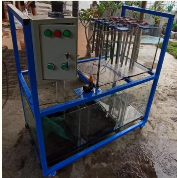
Gambar 3. alat elektrokoagulasi

Gambar ini menunjukkan alat elektrokoagulasi yang digunakan dalam penelitian untuk mengolah limbah batik. Alat ini memiliki rangka besi berwarna biru yang menopang sistem elektrokoagulasi. Bagian atas alat dilengkapi dengan elektroda-elektroda yang berfungsi sebagai tempat reaksi elektrokoagulasi. Panel kontrol dengan tombol hijau dan merah digunakan untuk mengontrol tegangan listrik dan durasi elektrokoagulasi. Selain itu, alat ini dilengkapi dengan beberapa kompartemen kaca yang memungkinkan pemantauan langsung terhadap proses pengolahan limbah. Dengan desain yang modular dan sistem pemantauan yang baik, alat ini diharapkan dapat meningkatkan efektivitas elektrokoagulasi dalam menurunkan parameter pencemar seperti COD, BOD, TSS, serta kandungan logam berat dalam limbah batik secara signifikan, sehingga limbah yang telah diolah memenuhi standar lingkungan yang ditetapkan.