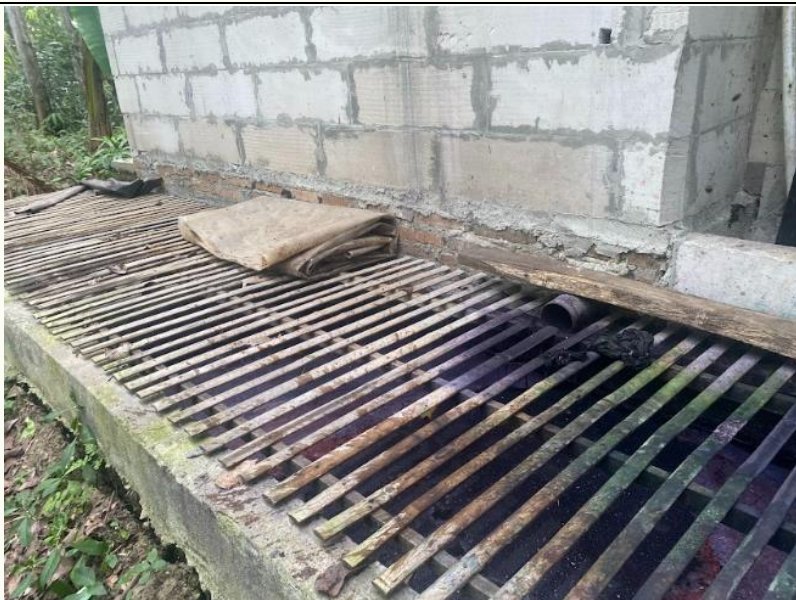
Gambar 1. Limbah Hasil Pengolahan Batik

Gambar ini menunjukkan kondisi awal limbah batik yang dihasilkan dari proses pewarnaan menggunakan pewarna sintetik. Limbah ini tampak terkumpul dalam sebuah penampungan terbuka dengan struktur kisi-kisi kayu di atasnya. Warna ungu kehitaman pada permukaan dan bagian bawah kisi-kisi menunjukkan tingginya kandungan zat pewarna dan kemungkinan adanya logam berat dalam limbah. Penampungan ini belum mengalami proses pengolahan, sehingga berpotensi mencemari lingkungan jika tidak ditangani dengan baik.