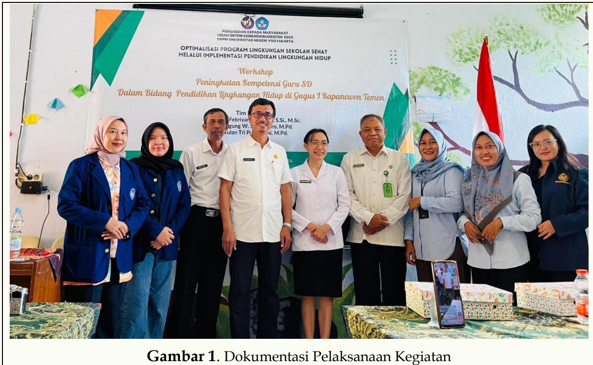
Gambar 1. Dokumentasi Pelaksanaan Kegiatan

memulai rangkaian kegiatan lain, yaitu pendampingan dan monitoring yang di dalamnya akan dilaksanakan proses transfer IPTEK.