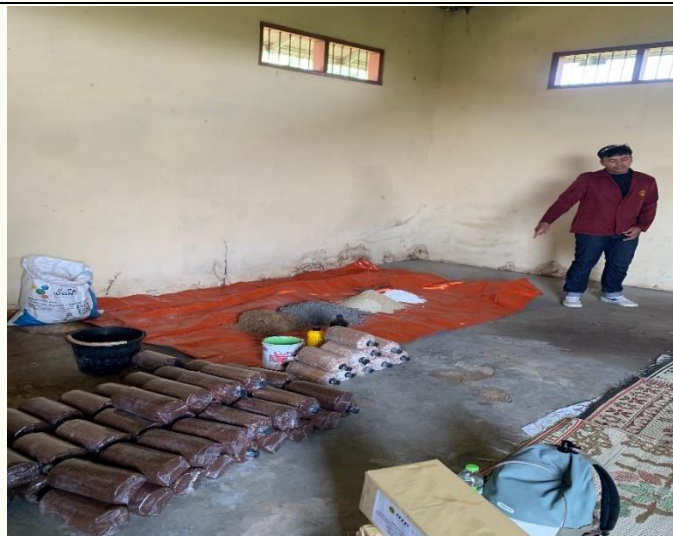
Gambar 4. pembuatan pupuk organik berbasis limbah mie so'on

Tim dosen memberikan arahan terkait takaran bahan, teknik pengadukan, dan pengaturan kelembapan untuk menjaga kualitas pupuk. Mahasiswa berperan aktif dalam demonstrasi teknis sehingga menciptakan proses pembelajaran yang komunikatif dan aplikatif. Kegiatan ini tidak hanya meningkatkan keterampilan teknis peserta, tetapi juga menumbuhkan kesadaran lingkungan mengenai pemanfaatan limbah organik secara ramah lingkungan. Dengan demikian, praktik ini berkontribusi terhadap transformasi limbah rumah tangga dan industri menjadi produk bernilai ekonomi sekaligus membuka peluang wirausaha berkelanjutan di tingkat komunitas desa.