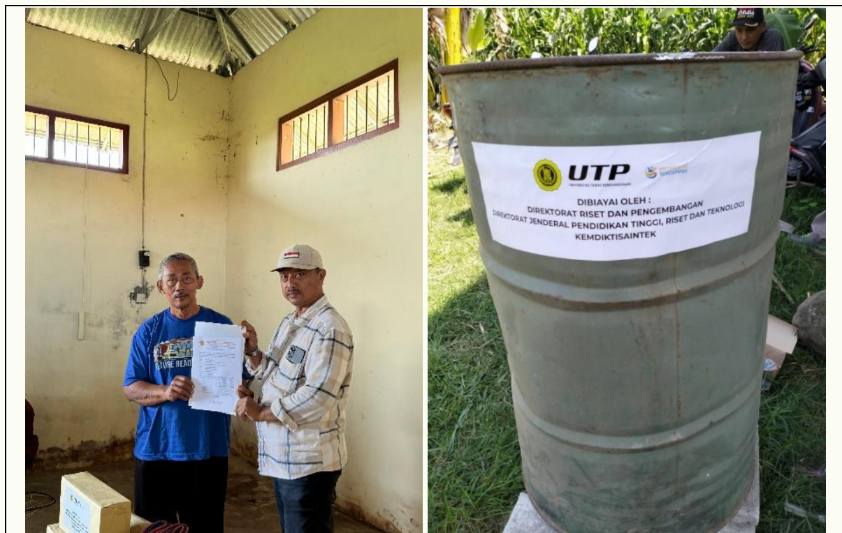
Gambar 8. Serah terima aset dan salah satu aset yang diberikan ke pihak Mitra

Keberlanjutan program juga didukung oleh peningkatan kapasitas anggota kelompok dalam pengelolaan usaha, yang sebelumnya diperkuat melalui pelatihan digital marketing dan edukasi konsumen. Dengan adanya serah terima aset ini, diharapkan terbentuk model kewirausahaan berbasis komunitas yang mampu mengintegrasikan pemanfaatan limbah lokal, inovasi pertanian organik, dan pemasaran digital sebagai satu sistem ekonomi berkelanjutan di Desa Pucangmiliran.