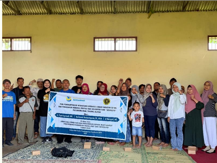
Gambar 2. Anggota Kelompok Tani foto bersama dengan Tim Pengabd