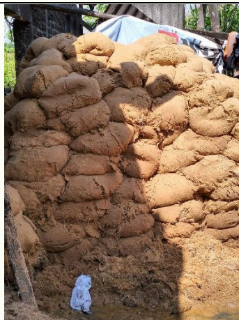
Gambar 1. Limbah padat industri mie so'on yang dibuang di tepi jalan desa dan tepi sungai di Desa Pucangmiliran.

Salah satu industri utama di desa ini adalah industri penggilingan pati aren atau tepung kolang-kaling. Tepung yang dihasilkan digunakan sebagai bahan dasar pembuatan sohon, yang menjadi produk penting dalam pembuatan makanan tradisional. Industri mie so'on di desa ini melibatkan 11 pengusaha dengan total 54 pekerja dan menghasilkan sekitar 9 ton batang aren setiap harinya. Limbah yang dihasilkan oleh industri mie so'on cukup besar, mencakup limbah padat sebanyak 3,6 ton, limbah cair 8.000 m 3 , dan limbah kulit sebanyak 2 ton per hari. Saat ini, sebagian besar limbah tersebut hanya dimanfaatkan sebagai pakan ternak. Namun, penelitian sebelumnya menunjukkan bahwa limbah tepung aren mengandung karbohidrat hingga 67% (Nurchahyo, 2015), yang berpotensi untuk dimanfaatkan lebih lanjut dalam produksi pupuk organik atau sebagai media untuk budidaya jamur tiram.