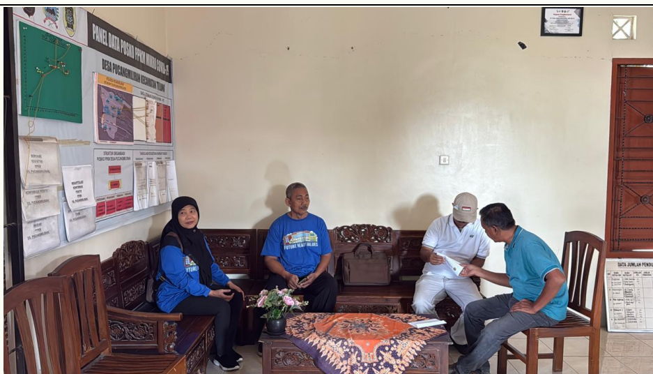
Gambar 3. Koordinasi awal dengan mitra dan perangkat desa (Dokumentasi penulis, 2025).

Diskusi partisipatif dengan mitra mengadopsi prinsip Asset-Based Community Development (ABCD), yaitu memanfaatkan aset lokal (limbah mie so'on) sebagai modal pengembangan ekonomi (Lestari et al., 2020; Phahlevy et al., 2024; Ridhani & Priyadharma, 2023). Pelaksanaan kegiatan juga memperhatikan Community Capitals Framework (CCF) yang menekankan pengembangan modal sosial, manusia, budaya, finansial, dan alam untuk keberlanjutan komunitas (Fitrianto et al., 2020; Flora & Flora, 1993). Kegiatan koordinasi dengan mitra dan perangkat desa dilakukan untuk memetakan potensi serta memastikan keterlibatan aktif seluruh pihak.