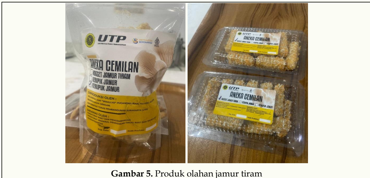
Gambar 5. Produk olahan jamur tiram

Diversifikasi produk ini memperluas peluang wirausaha anggota kelompok tani karena dapat menembus pasar kuliner sehat yang tengah berkembang. Selain bernilai gizi tinggi (protein nabati, vitamin B kompleks, dan mineral esensial), produk-produk tersebut juga berpotensi menjadi ikon pangan lokal jika didukung oleh kemasan menarik dan strategi pemasaran digital yang tepat. Dengan demikian, kegiatan ini tidak hanya meningkatkan keterampilan teknis peserta, tetapi juga memperkuat ekonomi kreatif berbasis pangan sehat di tingkat komunitas.